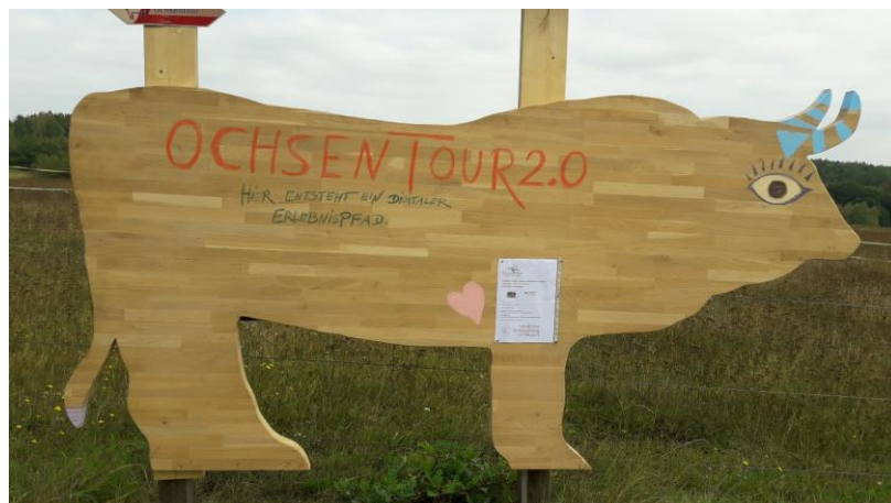
Der neu an der Ochsentour angebrachte Auerochse zum Beschriften und Bemalen

Rund um das Naturschutzgebiet "Leonie" bei Auerbach gibt es den Rundweg "Ochsentour". An diesem standen bislang Informationstafeln, die mittlerweile in die Jahre gekommen sind. Diese sollen nun zum Teil durch digitale Elemente ergänzt bzw. ersetzt werden, um den Themenweg auch für Kinder und Jugendliche interessant zu machen. Darum kümmert sich die Gruppe um Frau Reisch. Die neu angebrachte Holzsilhouette eines Auerochsen dient als Kreativelement und Gästebuch, auf dem mit Kreide Ideen und Grüße hinterlassen werden können.