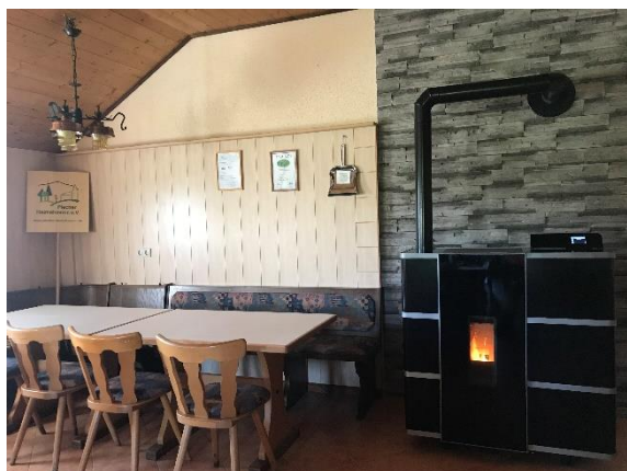
Der neu installierte Pelletofen im Vereinsheim des Plecher Heimatvereins

Der Plecher Heimatverein e.V. kümmert sich zum einen um die Wanderwege im Gebiet des Marktes Plech, zum anderen trägt er zur Pflege etwa der heimatlichen Kulturgüter, der fränkischen Mundart und des örtlichen Brauchtums bei. Dazu gehören unter anderem das jährliche Osterbrunnenschmücken, ein Mundarttheater und verschiedene Aktionen mit Kindern und Jugendlichen. Die verschiedenen Veranstaltungen und Aktionen werden im Vereinsheim durchgeführt oder vorbereitet.