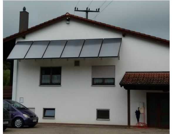
Die neue Solaranlage am Sportheim des FC Betzenstein e.V.

Durch das Regionalbudget der FrankenPfalz wird das Projekt „Solaranlage“ mit 10.000 €, durch einen Zuschuss des Bundesamtes für Wirtschaft und Ausfuhrkontrolle mit knapp 6.000 € unterstützt. Die Nettogesamtkosten belaufen sich auf 19.868,95 €.