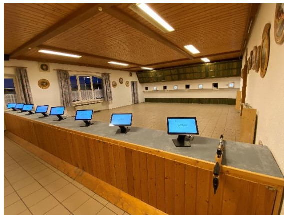
Die elektronischen Schießstände des SV Hufeisen-Weidensees e.V.

Der SV Hufeisen-Weidensees erhält über die Regionalbudget-Förderung der FrankenPfalz 8.733,71 €. An Nettogesamtausgaben können 10.917,14 € festgehalten werden.