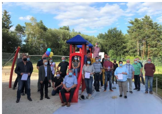
Alle Projektträger bei der "Bescheidübergabe" am 30.06.2020 auf dem fast fertigen Spielplatz am Gelände des SV Neuhaus-Rothenbruck e.V.

Durch das Regionalbudget der FrankenPfalz wird das Projekt „Spielplatz“ mit 10.000 € unterstützt. Die Nettogesamtkosten belaufen sich auf 16.739,82 €.