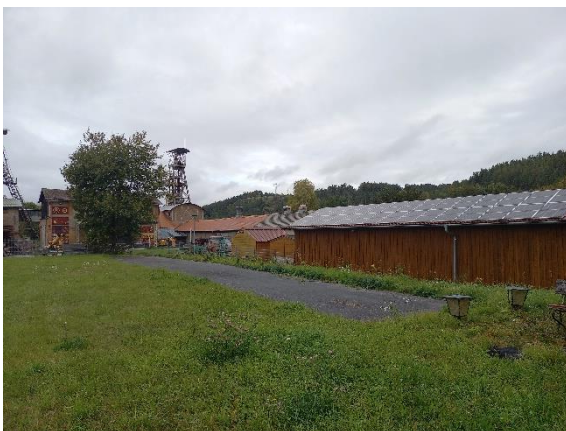
Das Gelände des Montandenkmals „Mafeischächte“ mit der vor Kurzem in Betrieb genommenen Photovoltaikanlage

Der Förderverein Maffeispiele e.V. betreut das Bergbaumuseum Maffeischächte in Auerbach und organisiert verschiedenste Events wie die Maffeispiele oder die weithin bekannte Bergwerksweihnacht. Das Ziel des Vereins ist es, das Montandenkmal „Maffeischächte“ kulturell zu beleben und das Wissen über die Bergbautradition der Stadt Auerbach an alle Interessierten weiterzugeben. Möglich wird dies zum Beispiel durch Konzerte, Theateraufführungen oder Ausstellungen und durch das Bergbaumuseum. Auf dem Dach eines Gebäudes im Museumsgelände wurde nun eine Photovoltaikanlage installiert, da für den Regelbetrieb des Museums sowie die zahlreichen Veranstaltungen hohe Stromkosten anfallen. Außerdem wollte der Verein einen Beitrag zum Klimaschutz leisten.