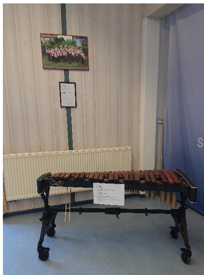
Das vielseitig einsetzbare Xylophon der Stadtkapelle Velden; Foto: L. Kustner

Zu den insgesamt 330 Mitgliedern der Stadtkapelle Velden gehören etwa 50 Musikschüler und 30 Kinder in musikalischer Früherziehung sowie 40 in der Kapelle aktiv Tätige. Ihr musikalisches Können zeigt die Stadtkapelle Velden regelmäßig bei Konzerten und Serenaden.