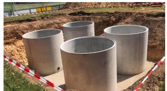
Einbau der Regenwasserzisternen am Gelände des SV Plech e.V.; Foto: F. Schuster

Aufgrund der zunehmenden Trockenheit stellt sich die Bewässerung der Sportplätze als immer schwieriger dar. Um das Grund- und Trinkwasservorkommen zu schonen, wurden vor Ort vier Regenwasserzisternen gebaut. Dabei wurden auch ehrenamtliche Stunden von Vereinsmitgliedern geleistet.