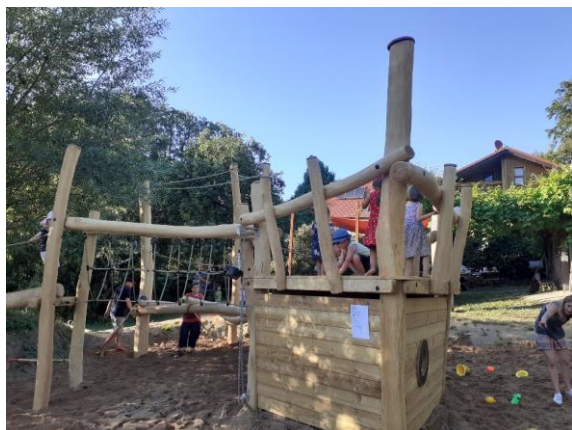
Das neue Kletterschiff auf dem Spielplatz in Betzenstein

Der Förderverein für die Spielplätze im Gemeindegebiet Betzenstein wurde 2009 gegründet. Seine Gelder akquiriert er vor allem aus Veranstaltungen und setzt sie direkt zur Verbesserung der Spielplätze vor Ort ein.