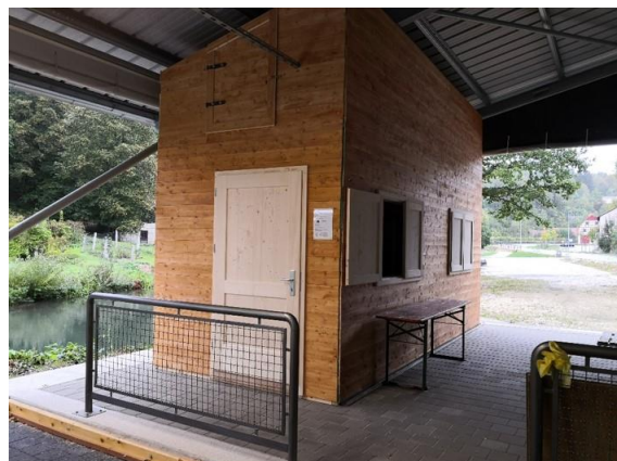
Die Versorgungshütte an der Stockbahn des TSV Velden e.V.; Foto: M. Taubmann

Da sich die Versorgung der an den Veranstaltungen Teilnehmenden immer als schwierig dargestellt hat, bestand die Idee eine „Versorgungshütte“ zu installieren. Diese konnte – wegen der Corona-Pandemie mit zeitlicher Verzögerung – in Zusammenarbeit mit regionalen Unternehmen Anfang September aufgebaut, angeschlossen und mit Küchenelementen eingerichtet werden.